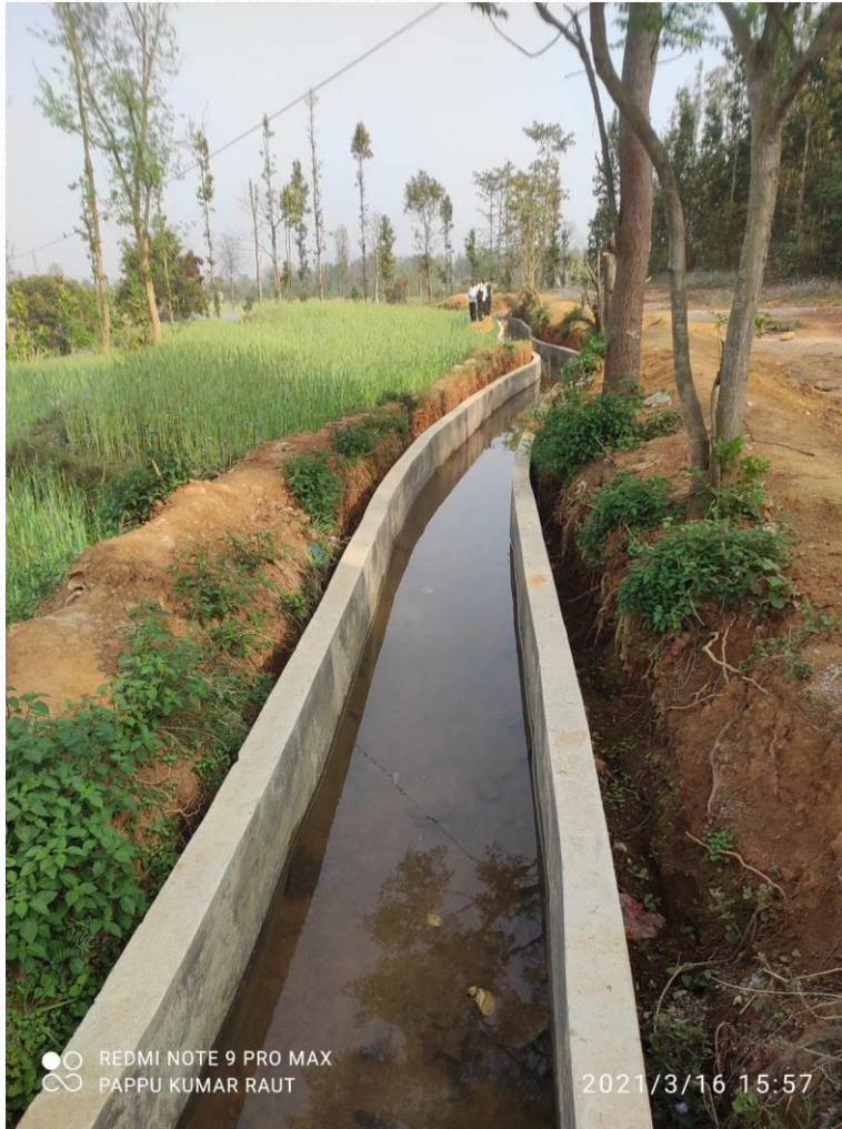
मैनतडा के-वर्ड सि.यो. भे.न.पा.-०८, सुर्खेत