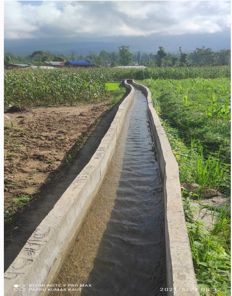
गदले सि.यो.पञ्चपुरी, सुर्खेत